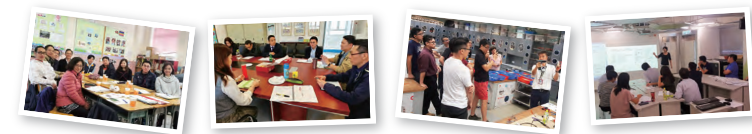
常識科「促進實踐社群以優化小班教學支援計劃」(小二常識)