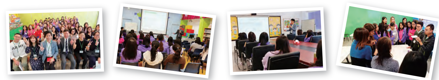
聯校幼小教師專業發展日(本校主辦)